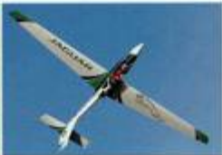
Fox von Gritsch