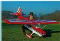
Bellanca von Hacker/CZ