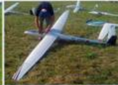
AN-66 von Fineworx