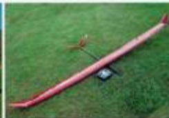
Klapperstorch 2 von Thiele