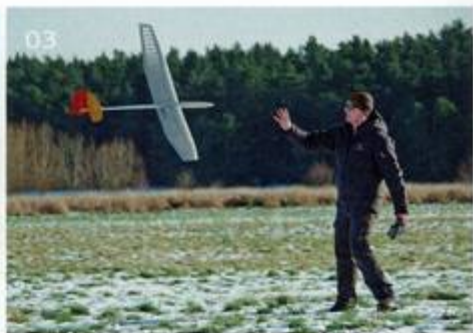
01 | Die Nasenleiste lässt sich dank der Schablonen gut verschleifen 02 | Der Start am Gummistart ist problemlos und ganz einfach auch alleine durchführbar 03 | Mit ein wenig Übung gelingt auch das Fangen zur Landung – wenn gleich das natürlich nicht regelkonform ist

hat hier sehr gute Arbeit geleistet, denn das verwendete „HS-55“ passt perfekt in den Servorahmen und kann weiterhin innerhalb der Fläche um gut fünf Millimeter verschoben werden. Um das benötigte Gestänge zu biegen, habe ich jedoch einige Anläufe benötigt. Entschädigt wurde ich hingegen mit einem Öffnungswinkel von 90 Grad bei einer gleichzeitig sauber schließenden Klappe. Erfreulich war anschließend auch der Gang auf die Schwerpunktwaage, denn rein durch den eingesetzten Empfängerakku lag der Schwerpunkt bei empfohlenen 72 Millimetern.