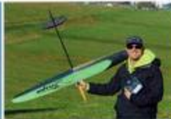
Snipe von Vladimir